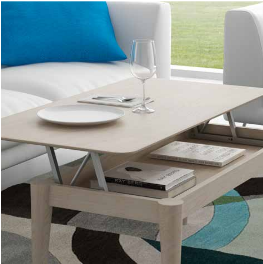
ref. MC2 Mesa de centro. Acabado: Roble nórdico. Coffee table. Finish: Nordic Oak Журнальный столик Отделка: Дуб Нórdico.