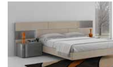
ref. 061 pg. 156-159