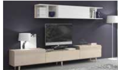
ref. 152 pg. 10-13