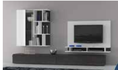
ref. 159 pg. 38-41