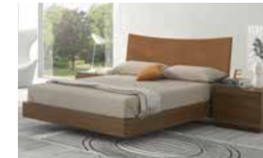
ref. 058 pg. 142-147