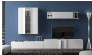
ref. 165 pg. 62-65