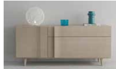
ref. A20 pg. 104-105