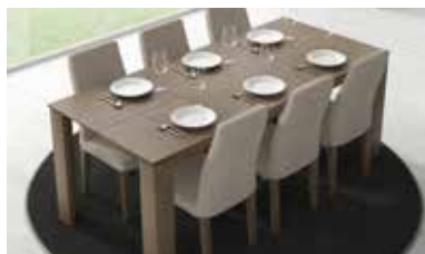
ref. M1 pg. 96-99