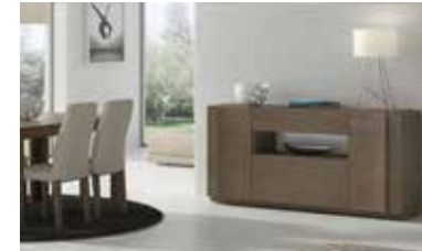
ref. A21 pg. 97