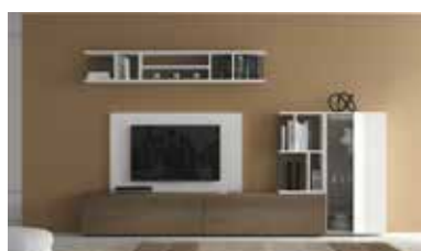
ref. 156 pg. 26-29