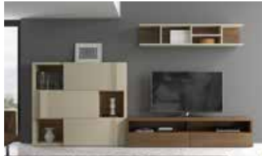
ref. 153 pg. 14-17