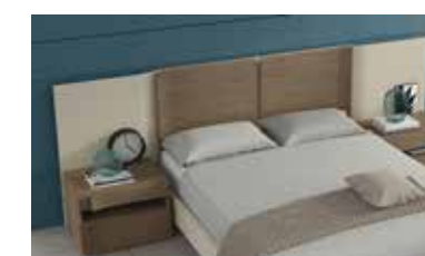
ref. 059 pg. 148-151