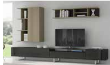
ref. 155 pg. 22-25