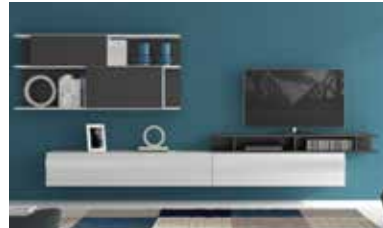
ref. 154 pg. 18-21