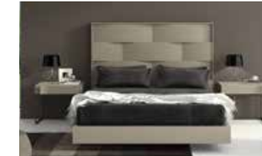
ref. 053 pg. 124-127