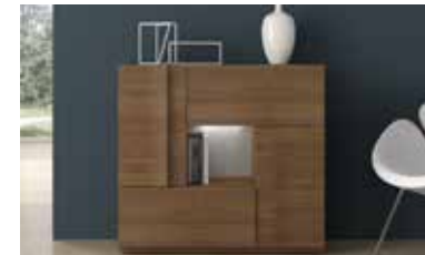
ref. A25 pg. 111