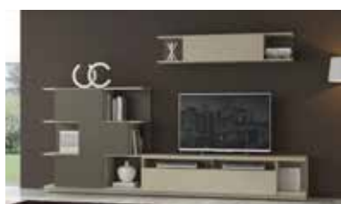
ref. 158 pg. 34-37