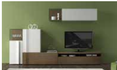
ref. 163 pg. 54-57