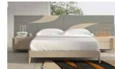
ref. 060 pg. 152-155