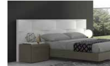
ref. 052 pg. 120-123