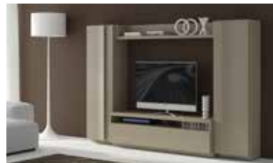
ref. 169 pg. 78-81