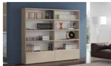
ref. 172 pg. 90-91