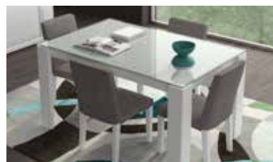
ref. M2 pg. 102-103