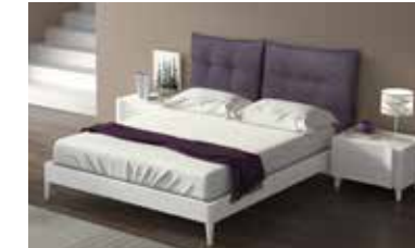
ref. 055 pg. 132-133