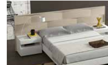
ref. 051 pg. 116-119