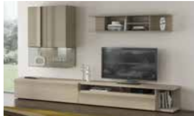
ref. 151 pg. 06-09