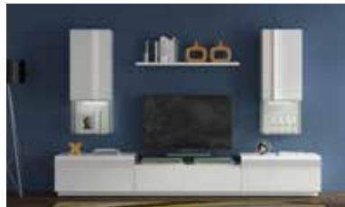
ref. 161 pg. 46-49