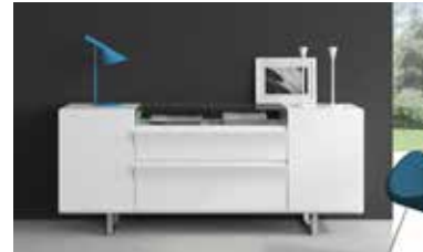
ref. A22 pg. 106-107