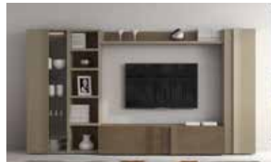
ref. 164 pg. 58-61