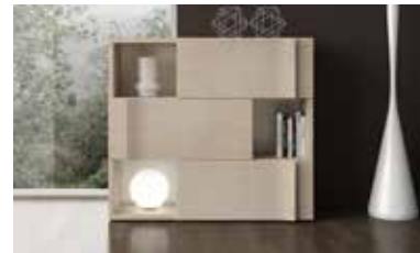
ref. A24 pg. 110