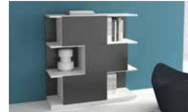
ref. A23 pg. 108-109