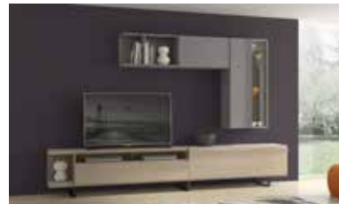
ref. 162 pg. 50-53