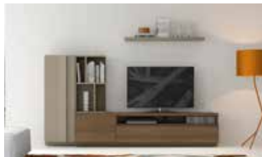
ref. 168 pg. 74-77