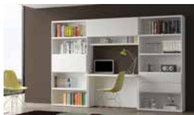
ref. 171 pg. 86-89