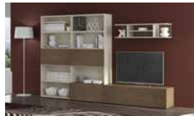
ref. 170 pg. 82-85