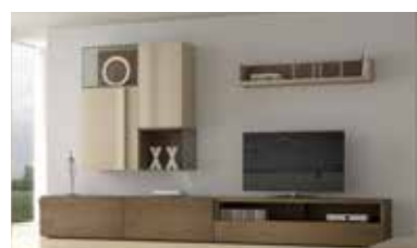
ref. 157 pg. 30-33