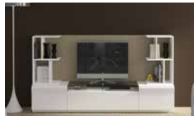
ref. 167 pg. 70-73