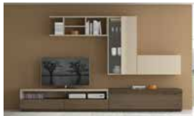
ref. 166 pg. 66-69