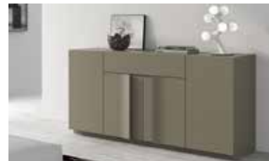
ref. A26 pg. 112