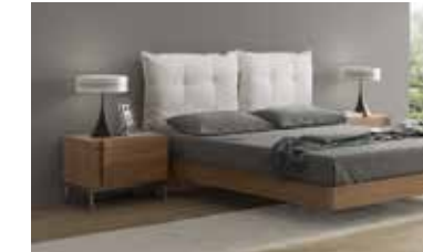
ref. 056 pg. 134-137