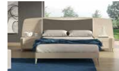
ref. 057 pg. 138-141