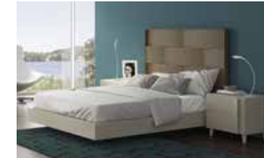
ref. 054 pg. 128-131