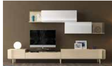
ref. 160 pg. 42-45