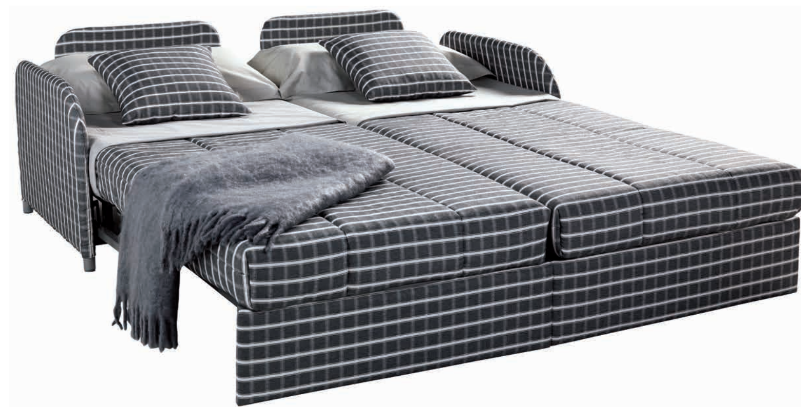
MOD. DOBLE: DOS CAMAS JUNTAS DE APERTURA INDEPENDIENTE.