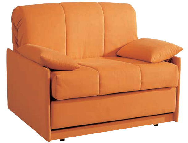
TÍBET CON BRAZOS