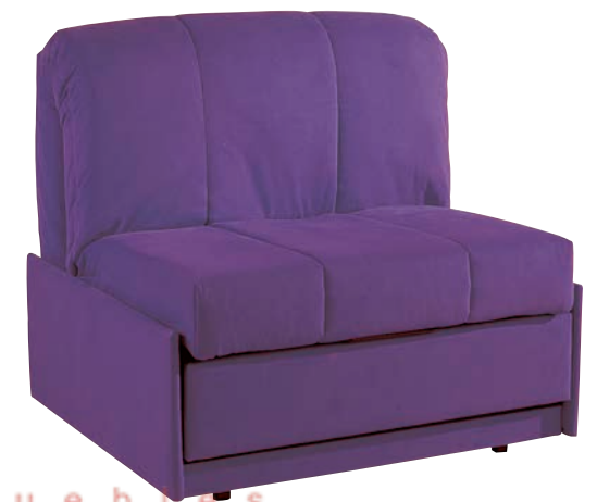
TÍBET SIN BRAZOS