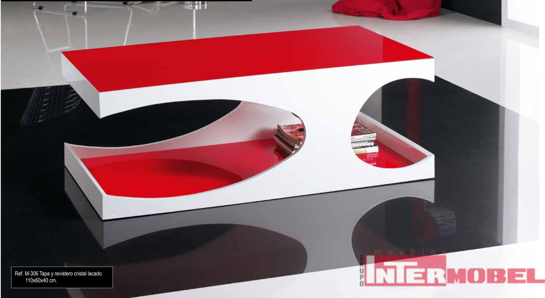
Ref. M-306 Tapa y revistero cristal lacado 110x60x40 cm.