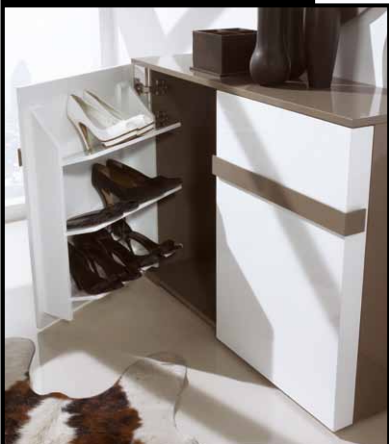
Capacidad para 12 pares