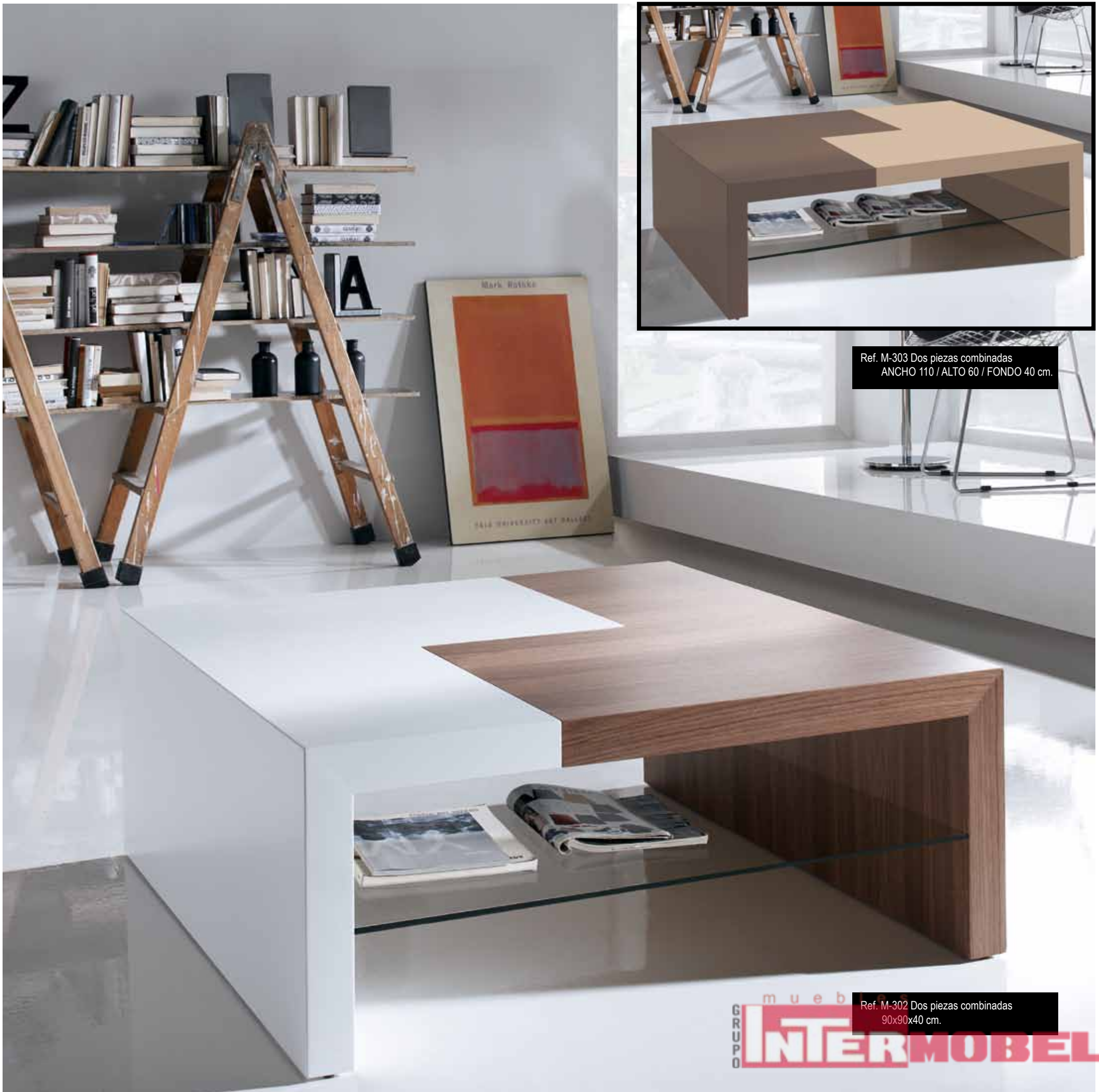
Ref. M-303 Dos piezas combinadas ANCHO 110 / ALTO 60 / FONDO 40 cm.