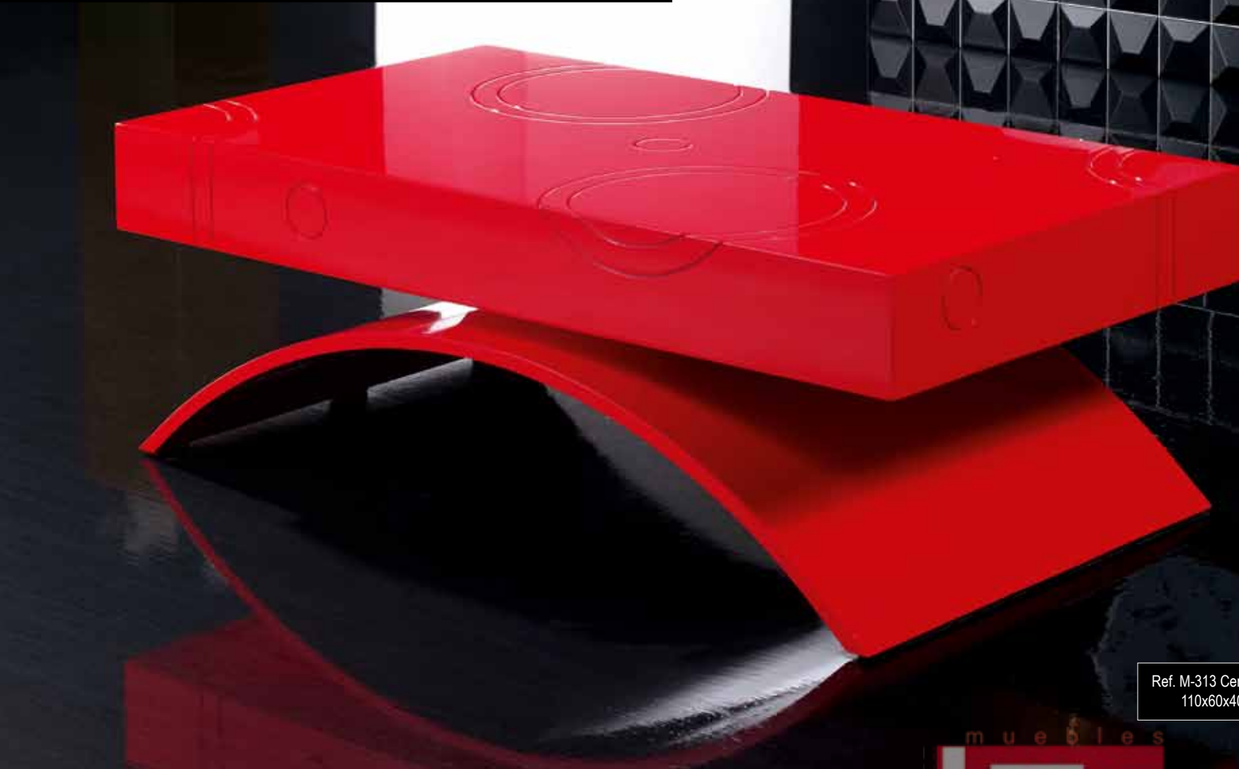
Ref. M-313 Centro elevable 110x60x40 cm.