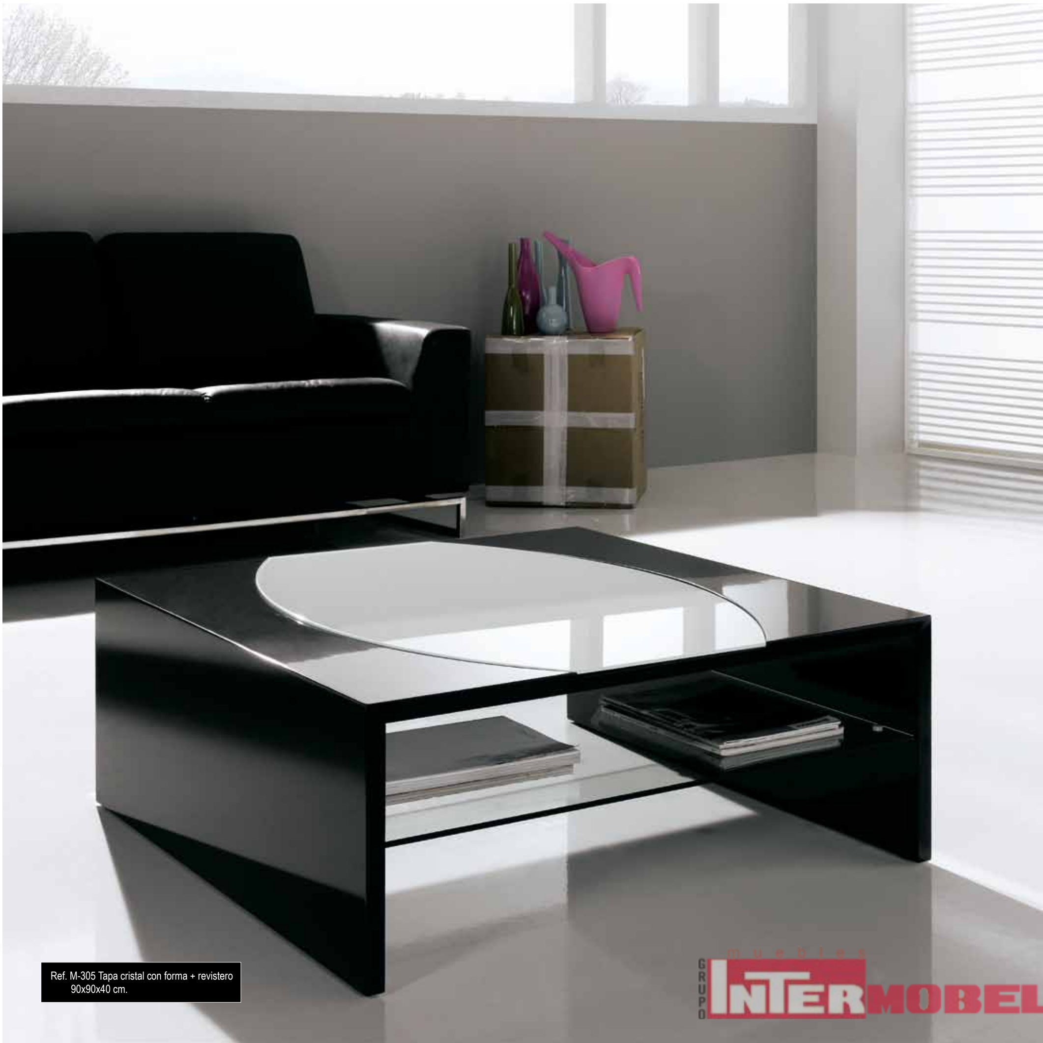
Ref. M-305 Tapa cristal con forma + revistero 90x90x40 cm.