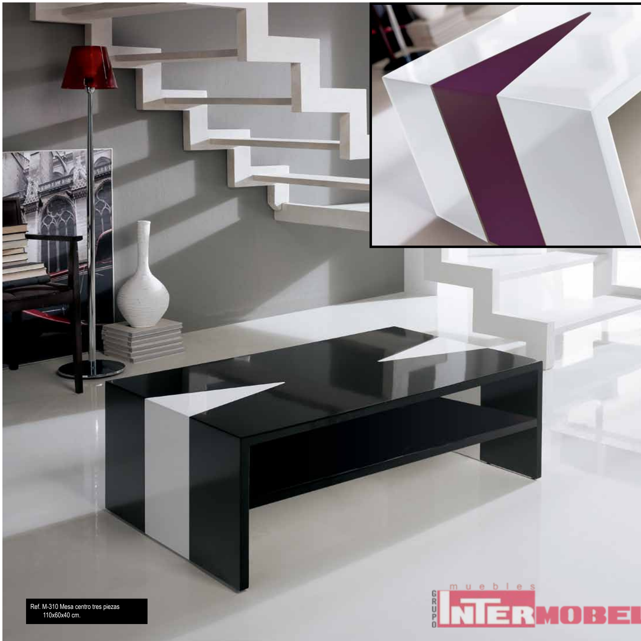
Ref. M-310 Mesa centro tres piezas 110x60x40 cm.