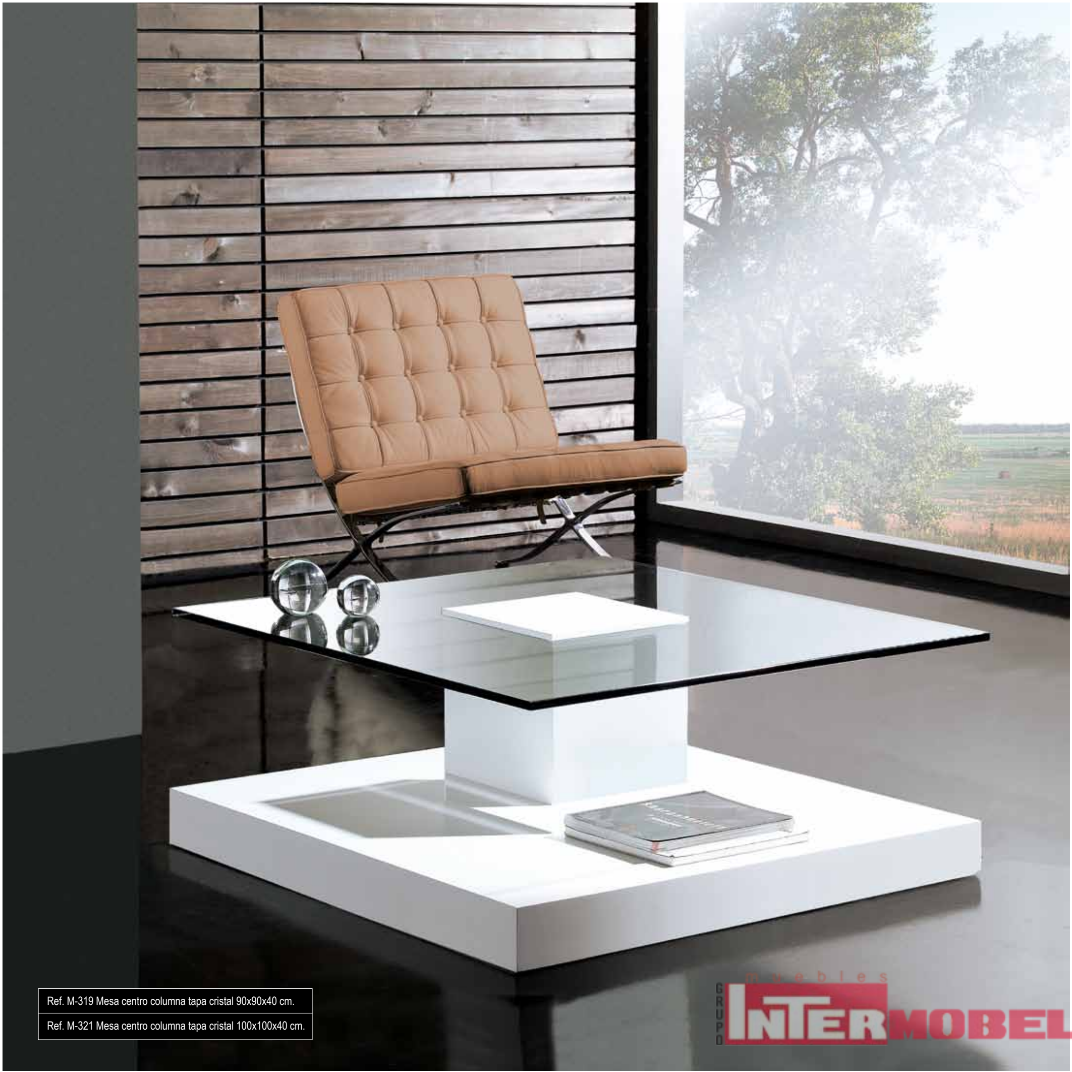
Ref. M-319 Mesa centro columna tapa cristal 90x90x40 cm. Ref. M-321 Mesa centro columna tapa cristal 100x100x40 cm.