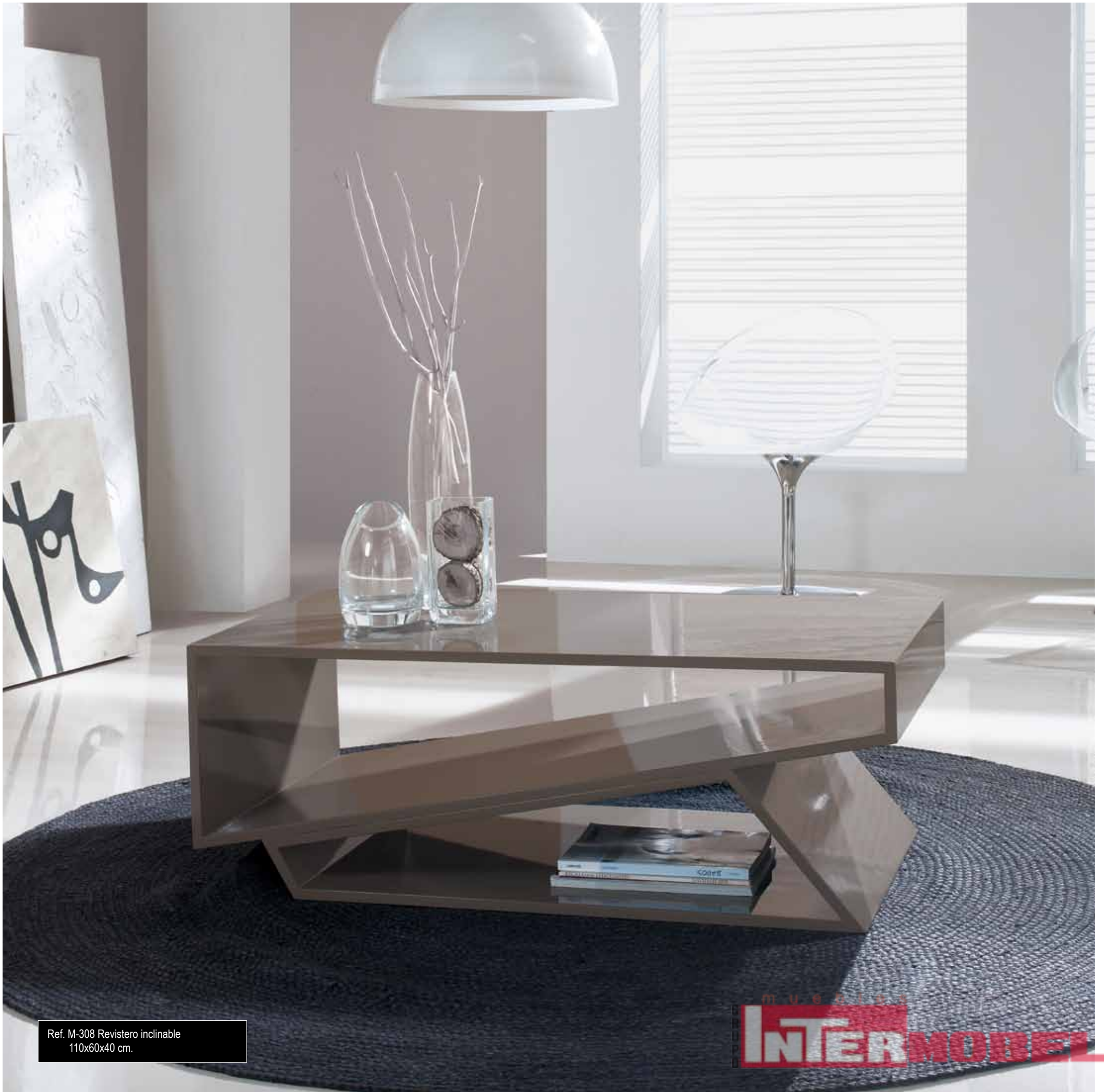
Ref. M-308 Revistero inclinable 110x60x40 cm.