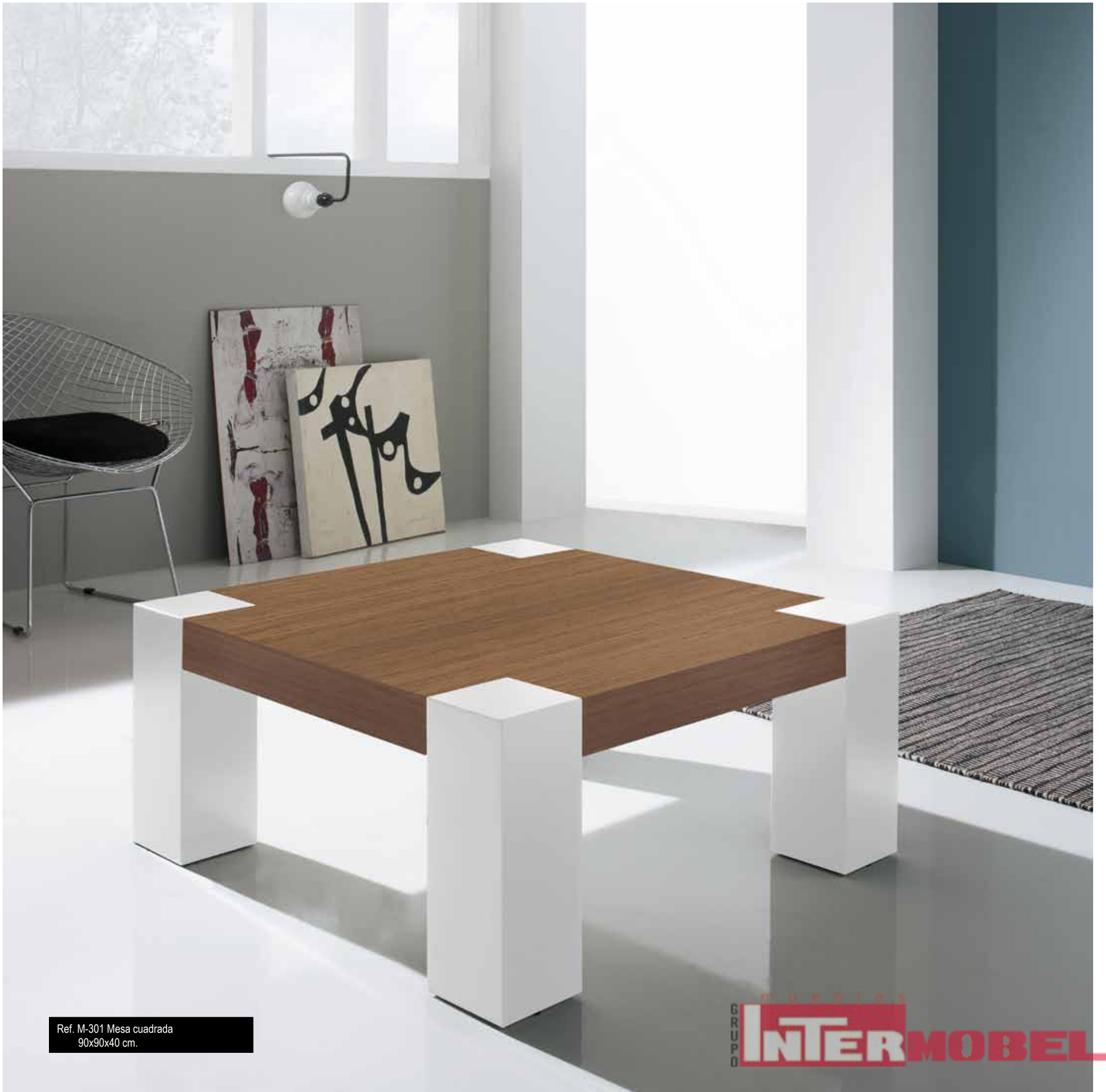
Ref. M-301 Mesa cuadrada 90x90x40 cm.