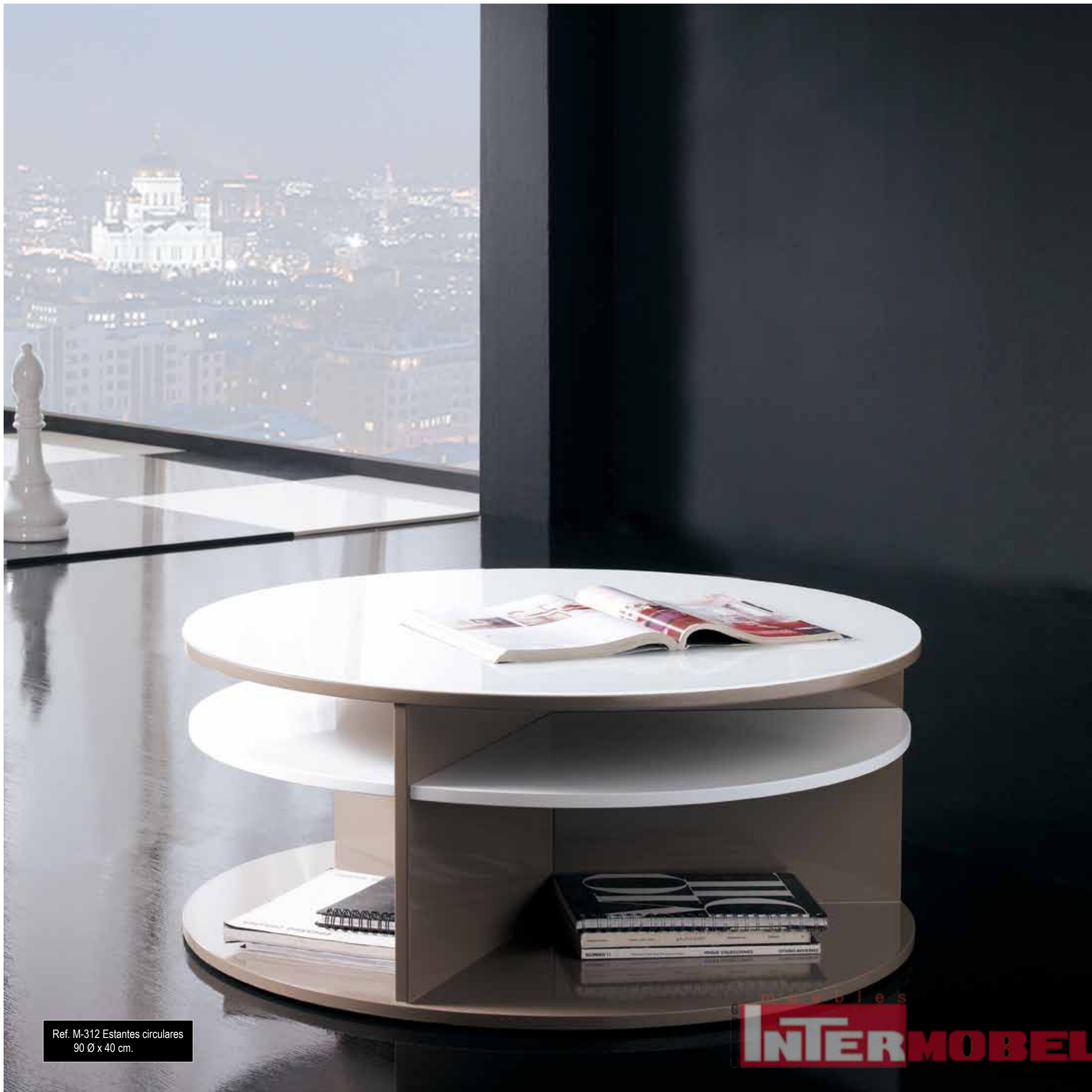
Ref. M-312 Estantes circulares 90 Ø x 40 cm.