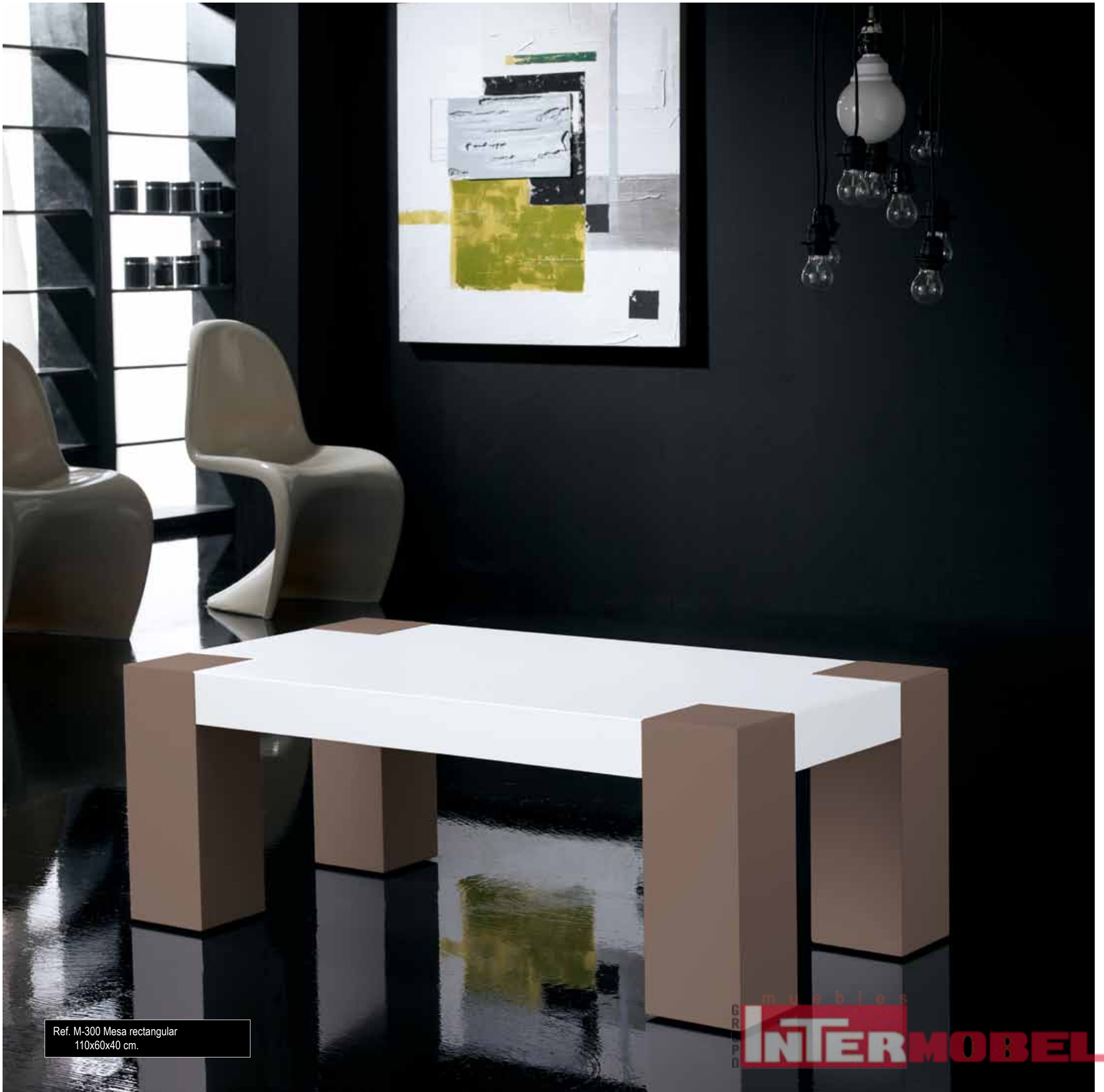
Ref. M-300 Mesa rectangular 110x60x40 cm.