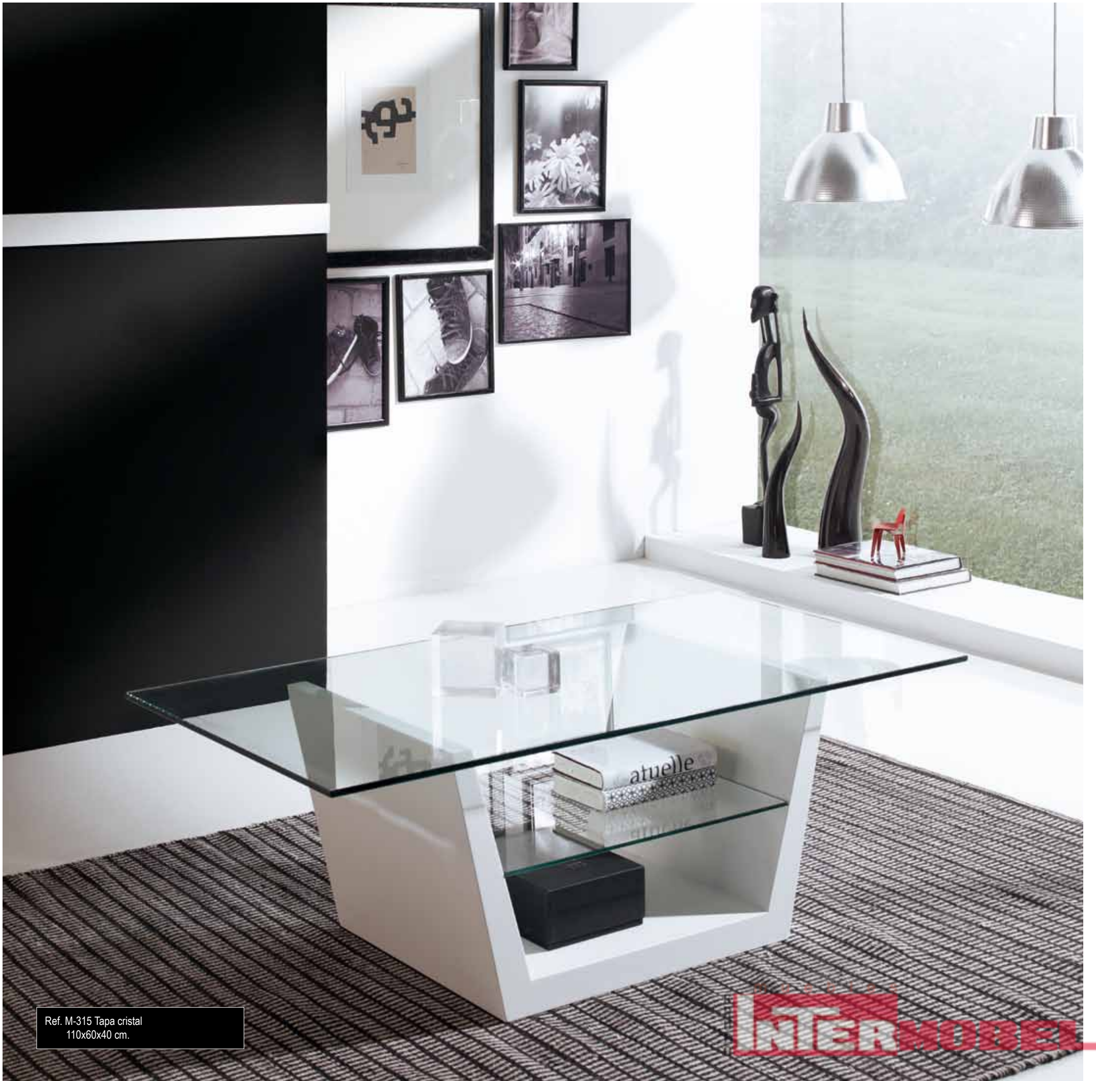
Ref. M-315 Tapa cristal 110x60x40 cm.