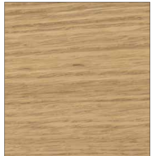
ROBLE NATURAL* / NATURAL OAK*

*Sólo aplicable a molduras, frentes y tapas de mesa. *Only applicable to moldings, fronts and table tops.