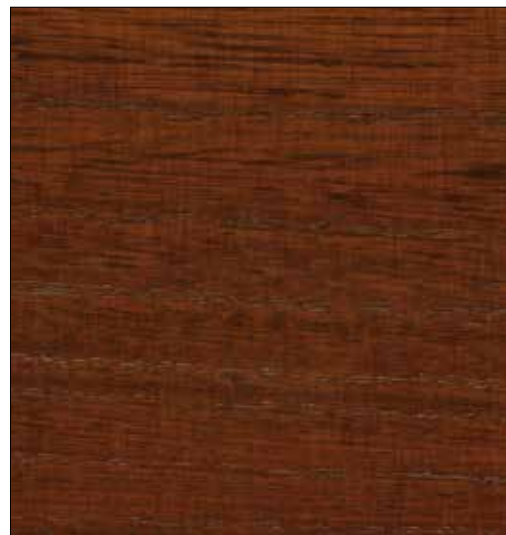
NOGAL TOUCH / WALNUT TOUCH