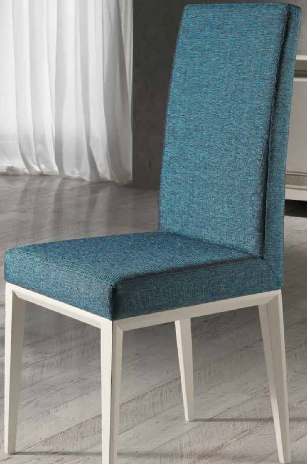
SILLA / CHAIR BLANCO / TAPIZADO RICHMOND 54 - WHITE / UPHOLSTERED RICHMOND 54 MEDIDAS / MEASURES: 46 x 57 x 107 CM