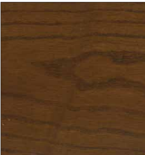
NOGAL 14 / WALNUT 14