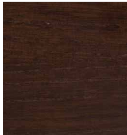
TABACO / TOBACCO