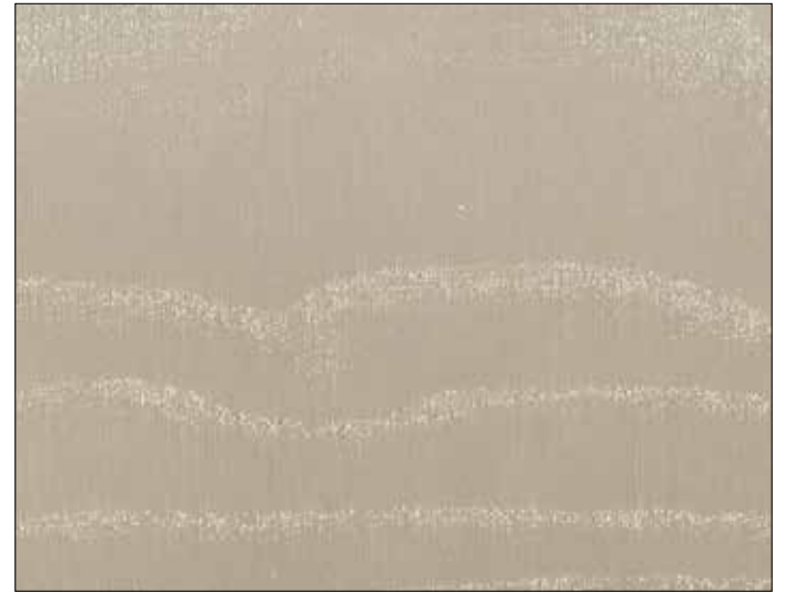
CAVA / CAVA